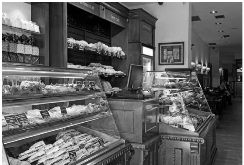
Una de les botigues del Fornet d'en Rossend

Gràcies de tot cor per aquestes accions tan solidàries.