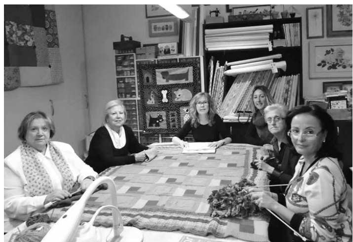
Taller de treballs manuals d'Oyambre