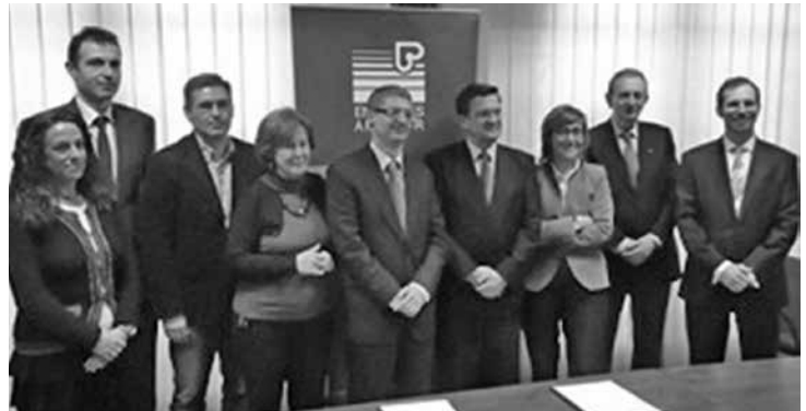
Representants de Càritas i de la Fundació AGBAR

es podran beneficiar d'aquesta rebaixa durant quatre mesos. En el cas de les persones que viuen en els pisos de lloguer social comptaran amb aquesta ajuda durant un any.