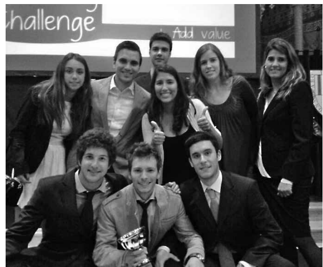
Guanyadors BCN Thinking Challenge

Des d'aquí felicitar als joves estudiants del Club d'Emprenedors per la seva iniciativa i implicació. Un exemple de com els joves prenen una actitud proactiva i constructiva davant la crisi.