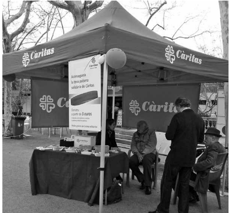
Voluntaris de Clubs amb cor en la carpa de Càritas

Volem agrair a la Volta la seva implicació i total col·laboració que ha permès una presència notòria de Càritas en aquest important acte esportiu.