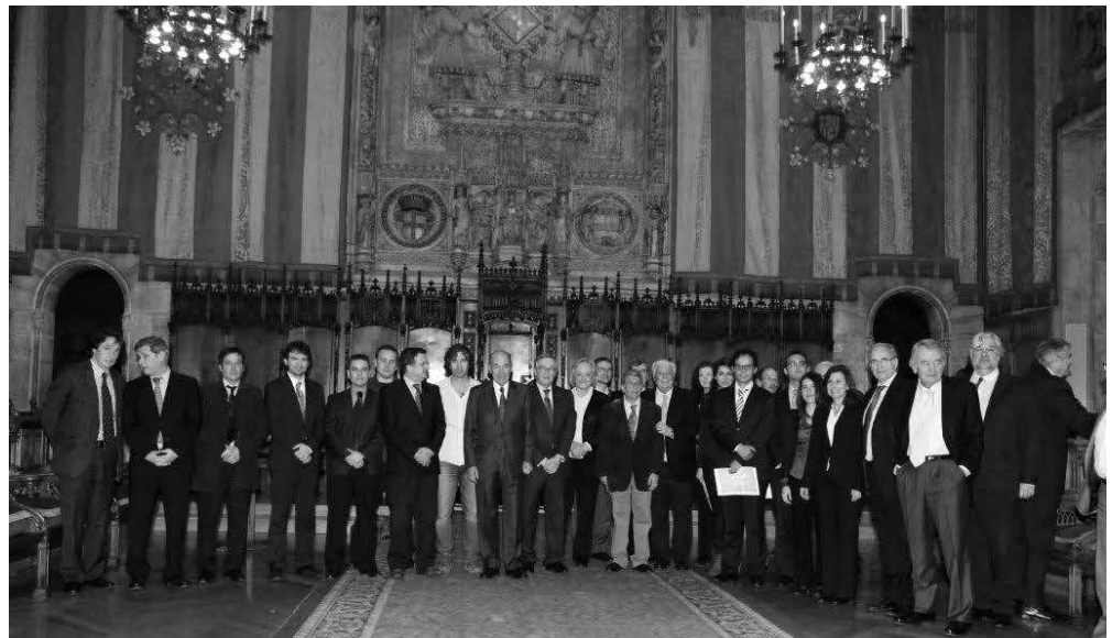
Acte d'entrega dels premis SEBAP al Saló de Cent de l'Ajuntament de Barcelona

El passat 13 en el transcurs del lliurament de premis de la SEBAP, Càritas va rebre el Premi Llegat Valldejuli , una distinció que s'entrega a l'entitat sense afany de lucre que ha destacat més en l'atenció a les persones més necessitades, sobretot en el camp de l'assistència familiar.