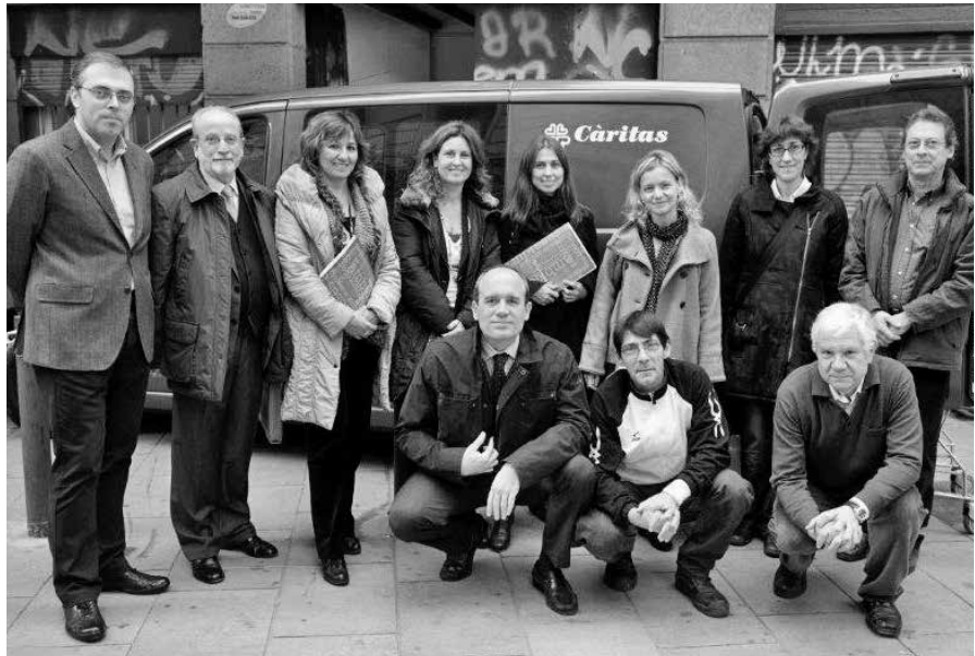
Treballadors de BASF amb representants de Càritas davant del magatzem

En nom dels que van tenir un millor Nadal els donem les gràcies a tots!