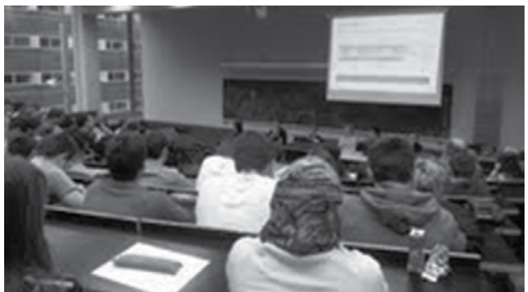
Assistents a la Taula de Bones Pràctiques