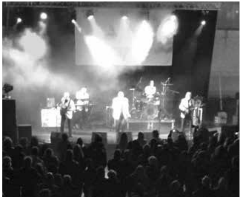
Concert al Club Esportiu Laietà

El Club Esportiu Laietà va proposar fer un intercanvi amb finalitat social. Per obtenir les entrades del concert, cada persona aportava aliments per valor de 15 € a la carpa de Càritas situada a la terrassa del Club, o bé podia comprar entrades al preu de 15 € . Tota la recaptació, que va ser un èxit, es va destinar a la compra d'aliments.